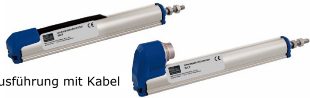
Ausführung mit Kabel